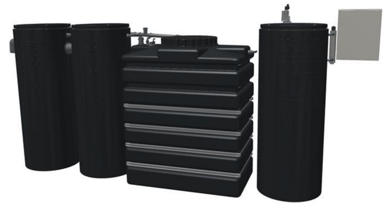
rear view Ansicht von hinten

sedimentation tank Sedimentationstank 2 x 500 l